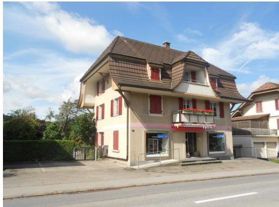
Standort Rohrbach, AWG, Werk-Atelier und Laden