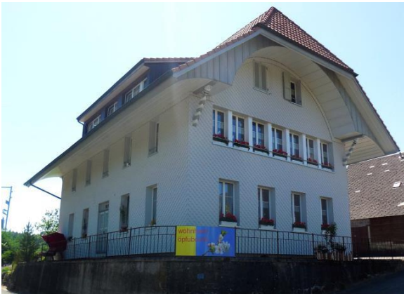
Haupthaus Nyffel, Wohnen, Pflege, Aktivierung

Aufsichts- und Bewilligungsbehörden sind einerseits die Bernische BVG- und Stiftungsaufsicht BBSA, sowie andererseits die Gesundheits- und Fürsorgedirektion des Kantons Bern GEF. Gegründet wurde die Stiftung im Jahr 1999.